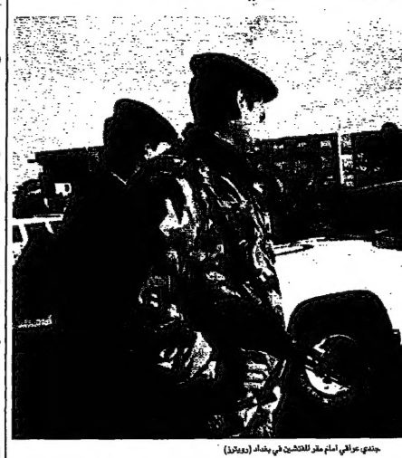
جنود عراقي امام مقر الفتح في بغداد (يوغيتا)

واشنطن - أعلنت واشنطن أمس أنها ستدعم خيار خضوع مقرات حزب البعث للفتيش، في حين رفضت بغداد هذا الخيار. وقالت واشنطن إن «الخيار العسكري ما زال قائماً». وقال مسؤولون أمريكيون في بيان مشترك، نشرته صحيفة «نيويورك تايمز» أمس، ما يدعى العالم الإسلامي وما يخصه على ما جاء في البيان.